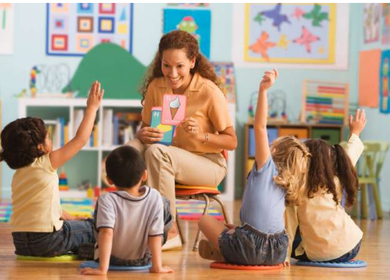
Asociación Nacional de Seguridad Infantil

"La prevención es la única vacuna eficaz para prevenir accidentes infantiles"